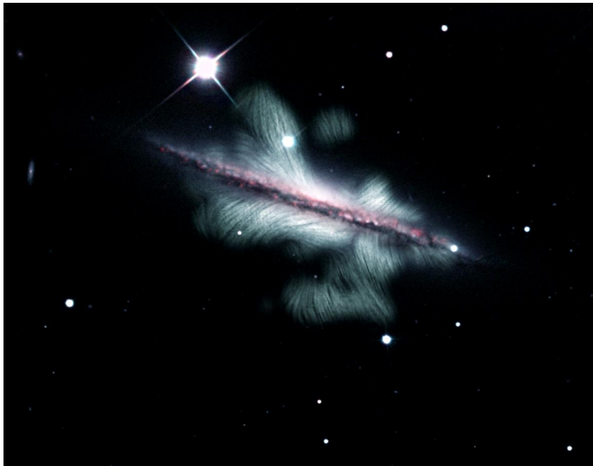
Magnetfeldstrukturen in NGC 4217